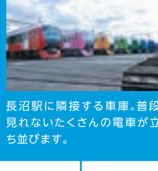
長沼駅に隣接する車庫。普段見れない皆さんの電車が立ち並びます。